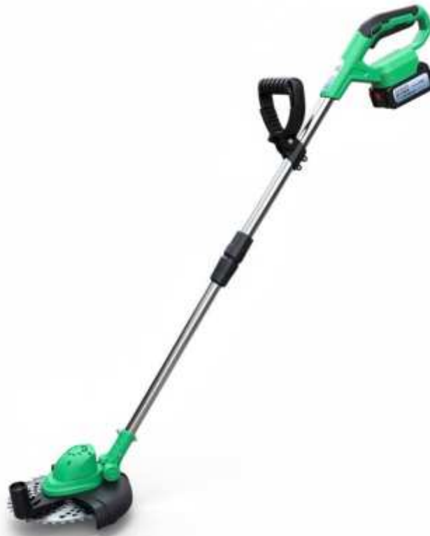
Podkaszarka przygotowana do pracy z akumulatorem.