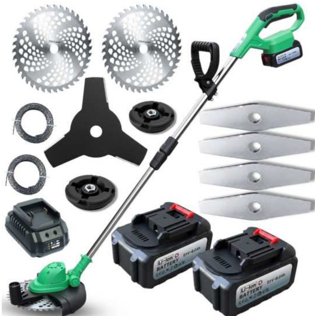
Zestaw podkaszarki z akumulatorami, ładowarką i nasadkami roboczymi.